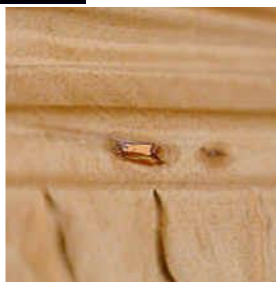
ภาพที่ 1 ลักษณะรอยแตกบนถุงรีโอร์ท

ที่มา: https://www.ifsh.iit.edu/iir-package-integrity/flexible-pouch