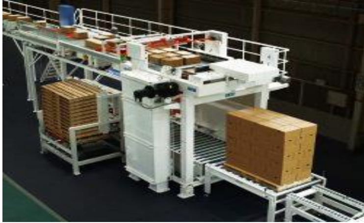
ภาพที่ 2 Conventional palletizers