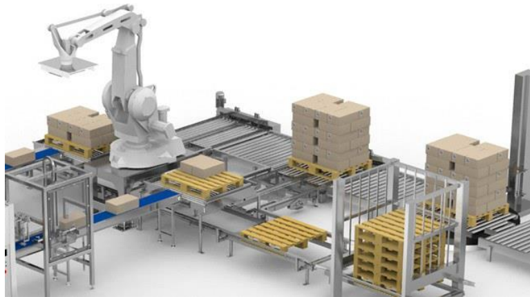
ภาพที่ 4 Robotic palletizing system