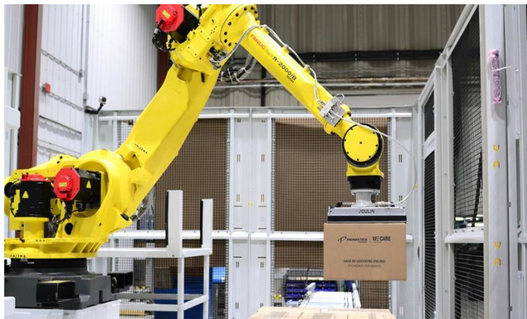
ภาพที่ 3 The gripping tool

ระบบการจัดเรียงสินค้าแบบ Robotic palletizing ถูกออกแบบมาเพื่อจัดวางกล่องสินค้าที่มาจากไลน์การบรรจุที่แตกต่างกัน เป็นระบบที่มีความยืดหยุ่นมาก โดยสามารถสร้างพาเลทที่ประกอบไปด้วยการวางเรียงของกล่องที่มีสินค้าหลากหลายชนิดได้พร้อมๆกัน ทั้งนี้ อุปกรณ์ในส่วนของหุ่นยนต์ที่ทำหน้าที่ในการหยิบจับสินค้า เรียกว่า gripping tool ซึ่งจะหยิบกล่องสินค้าจากระบบสะสมสินค้าเพื่อมาวางในตำแหน่งแต่ละที่บนพาเลท โดยตำแหน่งปลายของอุปกรณ์หยิบจับสินค้าสามารถปรับให้เข้ากับภาชนะบรรจุได้หลายประเภท