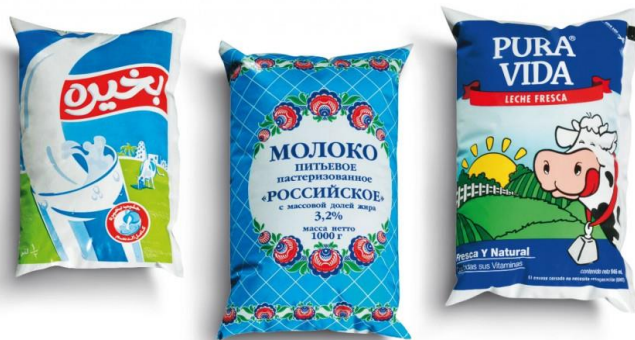
ภาพที่ 2 ตัวอย่างบรรจุภัณฑ์ pillow pouch