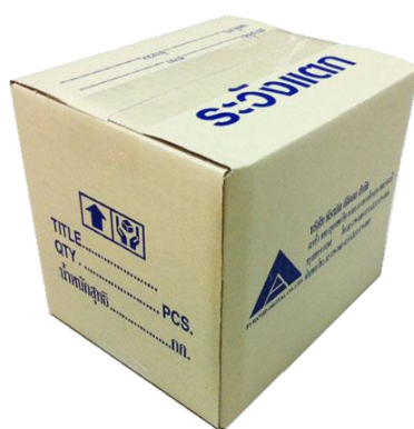
รูปที่ 2 กล่องกระดาษลูกฟูกแบบติดกาว

เป็นกล่องที่ใช้เวลาในการผลิตน้อยและสามารถใช้งานกับสินค้าทั่วไป กระบวนการผลิตจะใช้เครื่องพิมพ์และติดกาวอัตโนมัติ (Flexo Folder Gluer) ซึ่งเป็นเครื่องจักรที่รวมเครื่องพิมพ์ เครื่องเจาะร่อง เครื่องพับรอย เครื่องพับ และเครื่องทากาว (Printer Slotter และ Folder Gluer) เข้าไว้ด้วยกันในเครื่องเดียวกันในการผลิตกล่องชนิดนี้ แผ่นลูกฟูกจะทำการพิมพ์ ทำเส้นพับ และเจาะร่องเช่นเดียวกับกระบวนการผลิตของกล่องแบบเย็บสวด (Printer Slotter) จากนั้นเครื่องพับและเครื่องทากาว (Folder Gluer) จะทำการทากาวและพับประกบรอยต่อด้านข้างเข้าด้วยกันเป็นทรงสี่เหลี่ยมและได้เป็นกล่องสำเร็จรูปโดยอัตโนมัติ จากนั้นจะผ่านเครื่องนับจำนวนแล้วมัดเชือกตามจำนวนที่กำหนดไว้