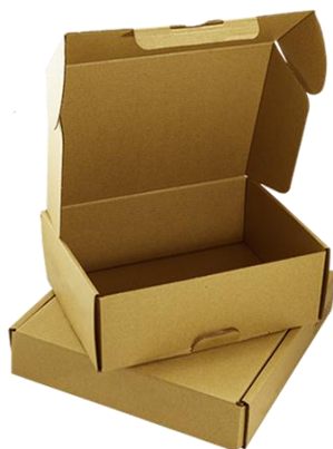
รูปที่ 3 กล่องกระดาษลูกฟูกแบบไคคัท

กล่องกระดาษลูกฟูกชนิดไคคัทนั้นถือเป็นกล่องกระดาษลูกฟูกแบบพิเศษที่ผลิตตามแบบที่ถูกดีไซน์เพื่อความสวยงาม โดยเฉพาะสามารถออกแบบให้ขึ้นเป็นรูปกล่องได้โดยไม่ต้องใช้สวดเย็บหรือการติดกาว