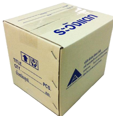
รูปที่ 1 กล่องกระดาษลูกฟูกแบบเย็บลวด

กระบวนการผลิตมีขั้นตอนคือ การนำแผ่นลูกฟูกที่ออกจากเครื่องผลิตลูกฟูก ที่มีการทำรอยทำเส้นพับฉากกล่อง ใส่ไปในส่วนป้อนแผ่นลูกฟูก (Feed Unit) ของเครื่องพิมพ์ โดยจะป้อนแผ่นลูกฟูกเข้าไปที่ละแผ่น เข้าไปยังส่วนพิมพ์ (Printing Section) เพื่อทำการพิมพ์บนกล่อง การพิมพ์จะมีจำนวนตู้สี่และแม่พิมพ์ของแต่ละสี่แยกออกจากกัน จากนั้นตัดลึนกาของกล่องที่ปลาย และเซาะร่อง (Slot) เพื่อแบ่งฉากกล่องแต่ละด้าน แผ่นลูกฟูกที่ออกมาจะเป็นลักษณะของแผ่นคลี่แล้วจึงนำไปขึ้นรูปโดยการเย็บลวด บริเวณลึนกล่องเพื่อเชื่อมด้านข้างเข้าด้วยกันเป็นทรงสี่เหลี่ยมโดยใช้เครื่องเย็บแบบกึ่งอัตโนมัติ หรือแบบอัตโนมัติ